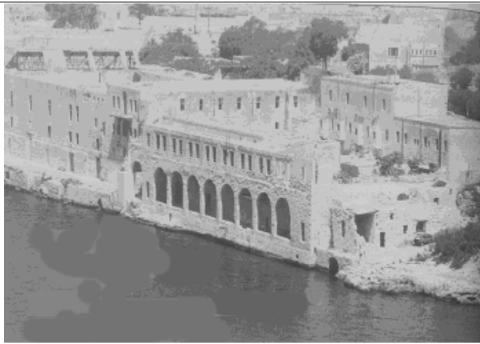
Il-Lazzarett: mibni mill-Kavallieri fuq il-gżira Manoel; użat mill-Inglizi għal dawk morda b'mard infettiv.