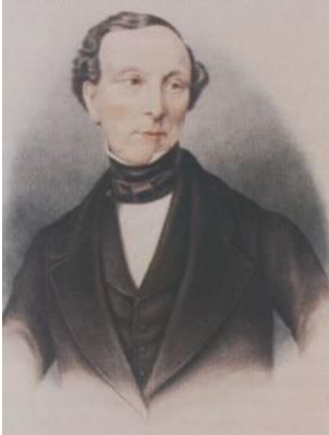
Richard Moore O'Farrell

is-sitwazzjoni għarrqet ħafna r-relazzjonjiet bejn il-Maltin u l-Inġliži. Fl-1846 Earl Grey laħaq Ministru tal-gwerra u tal-kolonji. Hekk kif sar Ministru Grey talab rapport dwar il-qagħda tal-kolonji fl-Imperu Inġliż. Ir-rapport dwar Malta xejn ma kien sabiħ għaliex Grey ġie nforat li l-Maltin kienu qed iduru kontra l-Inġliži għaliex riedu sehem fit-tmexxija tal-gżira. Ir-rapport wissa lill-Ministru li jekk l-affarijiet jibqgħu hekk, setgħet tinqala' xi rewwixta. Biex jikkla l-affarijiet Earl Grey ħatar lil Richard More O'Farrell bħala Gvernatur. Il-ħatra ta' O'Farrell għoġbot lill-Maltin l-ewwel net għaliex dan kien l-ewwel Gvernatur ċivili li qatt kellha Malta għaliex l-oħrajn kienu kollha nies militari u fuq kollox O'Farrell kien ukoll Kattoliku.