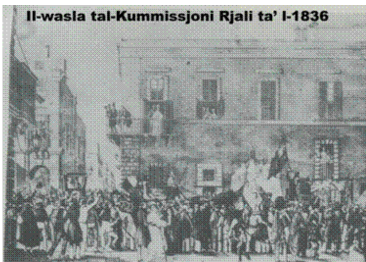
Dawn l-ilmenti tal-Maltin ġiegħlu lill-