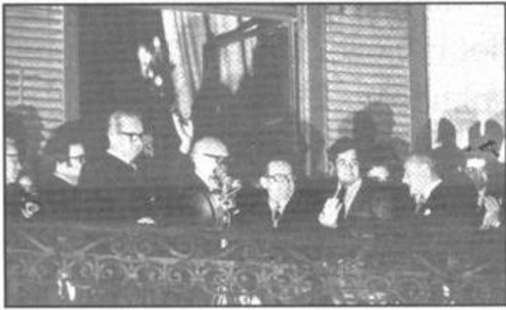
Malta dikjarata bħala Repubblika fl-1974. Jidher l- ewwel President Malti Sir Anthony Mamo u l-Prim Ministru Dom Mintoff. Ritratt fil- gallarija tal-Palazz il-Belt.

Il-Kostituzzjoni ta' l-1964 kienu sarulha tibdiliet żgħar fl-1974 bi qbil bejn il-Gvern u l-Oppożizzjoni biex saret il- Kostituzzjoni tar-Repubblika . Malta saret Repubblika, il-Kap ta' l-Istat sar President flok il-Gvernatur Ġenerali u r-Reġina ta' l-Ingilterra spiċċatilha kull setgħa f' Malta . Il-President tar-Repubblika irid ikun ċittadin Malti, elett mill-Parlament għal 5 snin biss. Din il-Kostituzzjoni, hlief għal xi tibdil żgħir, għadha sal-lum il-liġi suprema ta' Malta . Biex jinbidlu xi partijiet minnha jrid ikun hemm vot ta' mhux inqas minn żewġ terzi (2/3) tal-membri tal-Parlament (Gvern u Oppożizzjoni) flimkien. Emmenda importanti f' din il-Kostituzzjoni kienet saret fl-1987 meta Malta kienet iddikjarata bħala stat newtrali . Il-Partit politiku li jgħib 50% + 1 tal-voti fl-ewwel għadd, jingħata biżżejjed siggijiet fil-Parlament biex jiggverna. L-elezzjonijiet ġenerali li saru taht din il-Kostituzzjoni ntrebħu hekk: 1976=MLP; 1981=MLP; 1987=PN; 1992=PN; 1996=MLP; 1998=PN.